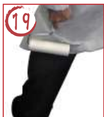
19 ← 左足後ろ