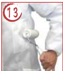
13 左胴横 →