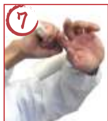
7 ← 左腕表