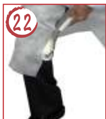
22 右足横内側 →