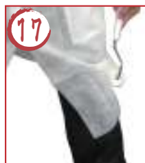
17 ← 左足横外