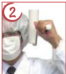
2 頭横1 →