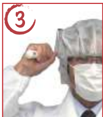
3 頭横2 →