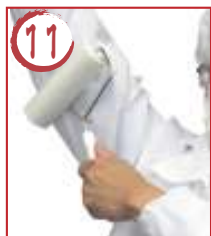
11 右腕内側 →