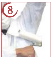
8 ← 左腕内側