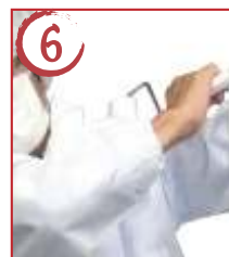
6 ← 左肩