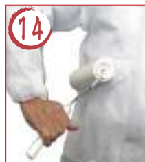
14 右胴横 →