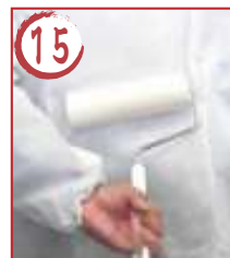
15 胴後ろ ↓