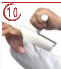
10 ↓ 右腕表