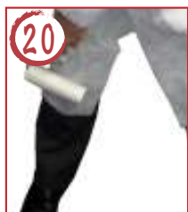
20 ↓ 右足前