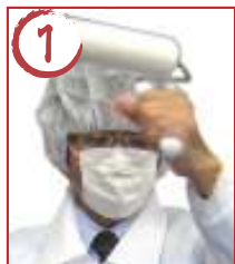
1 頭上 →