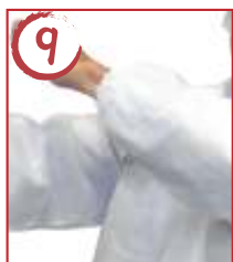
9 ← 右肩