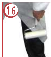
16 ← 左足前