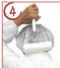
4 頭後ろ →