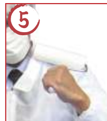
5 首周り ↓