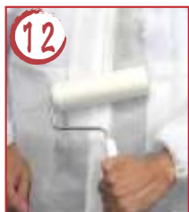
12 胴前 →