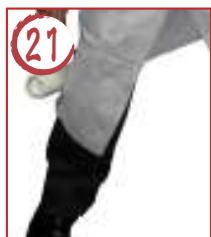
21 右足横外 →