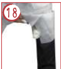
18 ← 左足横内側